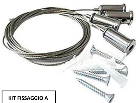
KIT FISSAGGIO A SOSPENSIONE